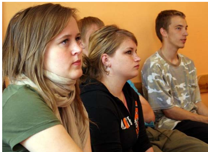
Dagliga rutiner ger balans