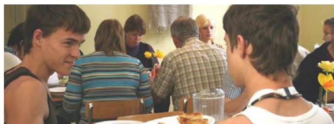
En harmonisk miljö är grogrund för rehabilitering och utveckling.

När ansökningarna kommit in kallas alla till ett samtal med våra socialpedagoger, som ansvarar för intagningen. Vi har inte resurser att ta emot pojkar och flickor med för svåra psykiska problem eller utvecklat missbruk och därför görs en bedömning före intagning. Alla Livslusts elever kräver mycket stöd till följd av svåra erfarenheter från uppväxtåren. Flera har smärre mentala handikapp och många saknar framtidstro och motivation att studera.