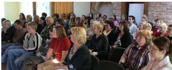
Skolpersonal, socialarbetare och blivande elever vid en presentation av Livslust i Aizupe den 24 april.

Livslust vänder sig i huvudsak till två kategorier utsatta tonåringar. De som saknar egna familjer och finns på statliga skolinstitutioner och de som finns i familjer med allvarliga sociala problem. Gemensamt är att de har en svår uppväxt bakom sig och är i lika stort behov av rehabilitering som av yrkesutbildning. Det är frivilligt att komma till Livslust och intresserade ungdomar är välkomna till skolan för att själva bilda sig en uppfattning om verksamheten. För att nå ungdomarna bjuder vi in personal från skolinstitutioner och socialkontor till en Öppet Hus-dag i Aizupe. De tar med sig elever som ska sluta grundskolan och därmed måste lämna institutionen. En del elever har inte godkända betyg och svårt att komma in på statliga yrkesskolor. Till Livslust är man välkommen även om man inte klarat 9an med godkänt resultat.