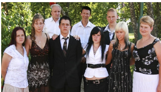
Examen för sömmerskor och målare i juni.

Tillit, Kunskap, Självkänsla, Självförtroende, Initiativ, Ansvar, Kreativitet, Samarbete