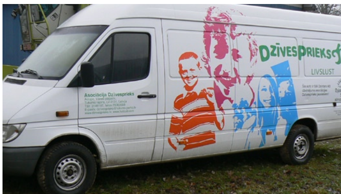
Minibussen har vi fått från den lettiska firman Dzintars Sia.