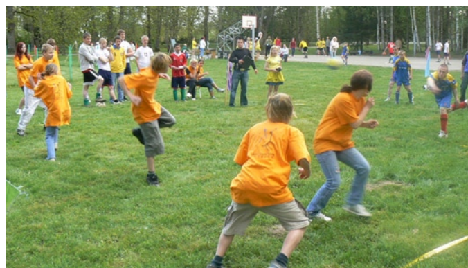
Vi bjuder in andra skolor och barnhem till idrottstävlingar flera gånger varje år.

Livslust julkort finns att beställa via e-post livslust@telia.com eller telefon 08-660 77 84. Kortet har julhälsning och information om Livslust på svenska, engelska och lettiska och kostar 25 kronor/styck.