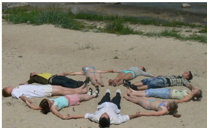
Kamrater i sanden, utflykt till havet i juni.

går att beställa från kansliet livslust@telia.com